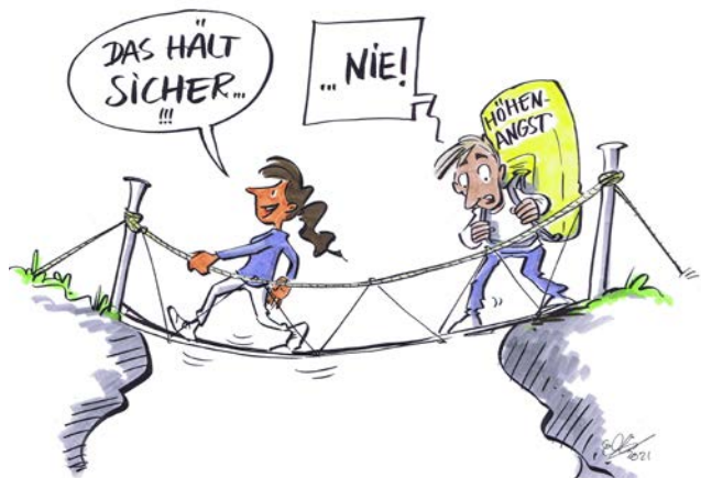
Abb. 1 Unterschiedliche Herausforderungen gehen mit individuellen Risikowahrnehmungen einher.

Eine gute Kommunikation über Risikosituationen zeichnet sich dadurch aus, dass allen Beschäftigten klar ist, welche Risiken im Alltagsbetrieb bestehen können (bspw. Unfallrisiken), wieso Organisationen von bestimmten Risiken