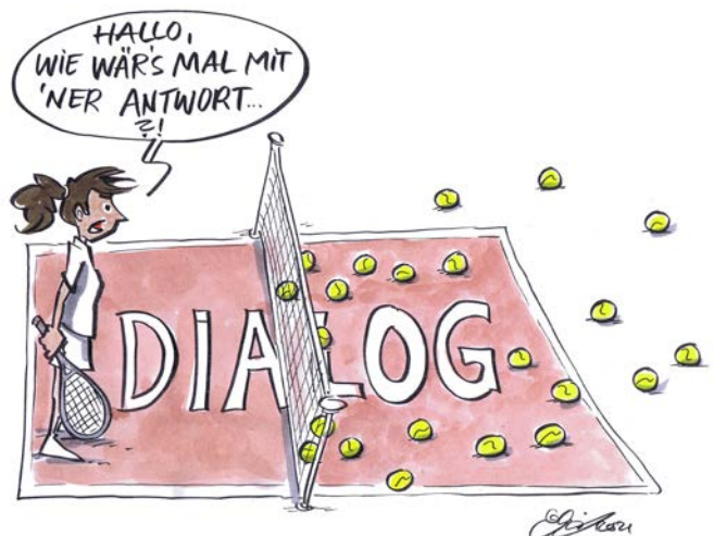
Abb. 3 Gut kommunizierte Maßnahmen führen zu gegenseitigem Vertrauen.

Halten sich dennoch nicht alle an die Regeln, ist es wichtig, durch die Leitung bzw. Führungskraft den Standpunkt für das Allgemeinwohl zu bekräftigen und die Relevanz der getroffenen Maßnahmen auch kommunikativ innerbetrieblich zu stärken. Tritt dies nur vereinzelt auf, kann das Gespräch auch mit Einzelnen aufgesucht werden.